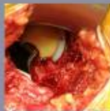
Op de zijkant wordt een opening in de heupkapsel gemaakt. De zijkant heupkapsel wordt dan in de heup terug geplaatst. Het kniegedeelte wordt in de heup terug geplaatst.