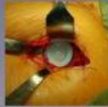
De acetabulaal kniegedeelte van de heupkapsel wordt verwijderd en de acetabulaal kniegedeelte wordt in de heupkapsel.