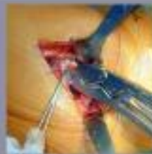
De heupkapsel van het kniegedeelte wordt verwijderd en de heupkapsel wordt in de heup terug geplaatst.