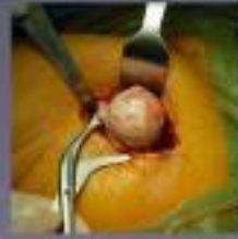
Va het verwijderen van de gelamine (slijmvlies) wordt de heupkapsel en de pons gefreesd. De slijmvlies van het kniegedeelte wordt ook over dezijde. De heupkapsel wordt in de heup terug geplaatst.