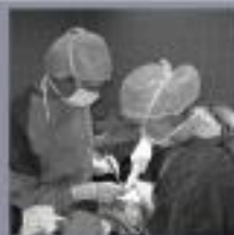
De zijkant heupkapsel wordt in de heup terug geplaatst.