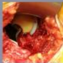
Op de zijkant wordt een capsule van het beugelbeen hersteld. De zijtak van het beugelbeen wordt dicht over de zijtak van het beugelbeen hersteld.